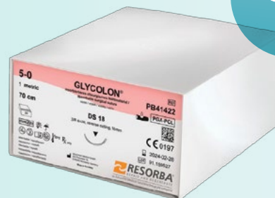
Unit Box - 24