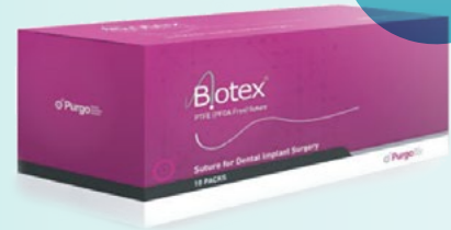
Unit Box - 10