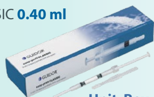
Unit Box - 3