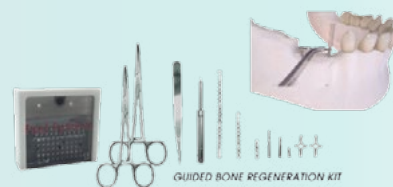
GUIDED BONE REGENERATION KIT