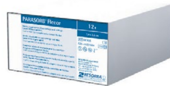
Unit Box - 12