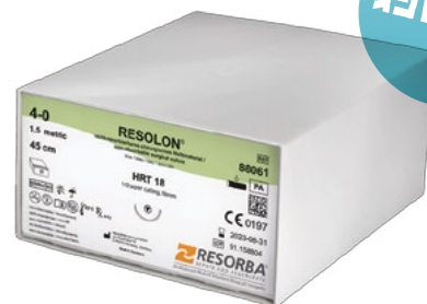
Unit Box - 36