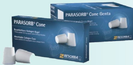
Unit Box - 10