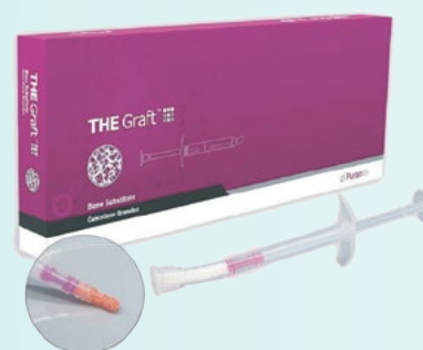
Unit Box - 1