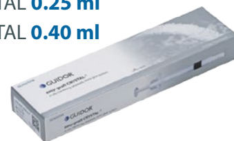
Unit Box - 3