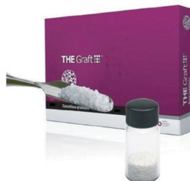
Unit Box - 1